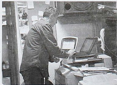
Detalj iz fotokopirnice „Demeli“

- Zaprijetili su nam tužbom i mi to više ne radimo. Ostale kopiramo. Ova oblast nije uređena i sjutra da nam kažu naredni da ne radimo ovo, mi ćemo prestati. U sve treba uvesti red - kazali su oni.